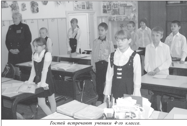
Гостей встречают ученики 4-го класса.