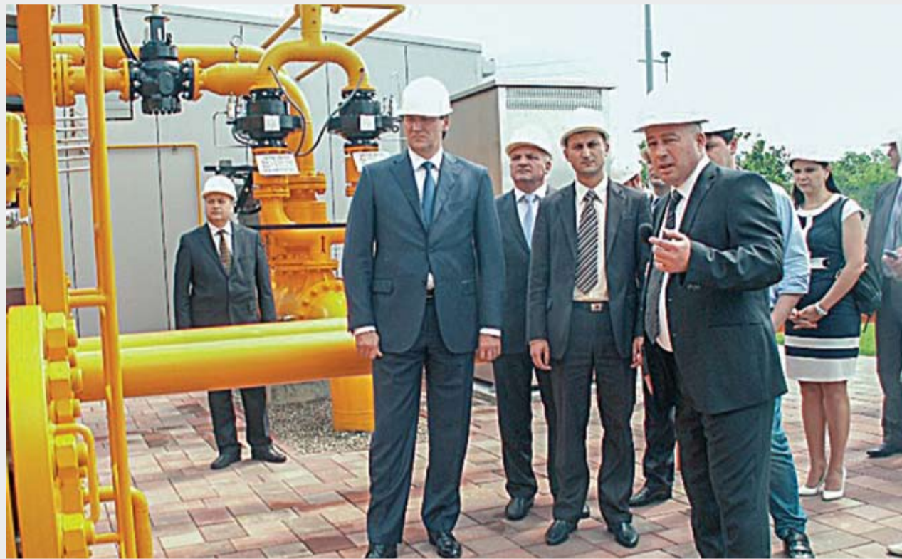
Компания планирует заменить на новые все газораспределительные станции.